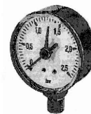
*Figura 1: Manometro 0-2,5 Bar amico modulare con lancetta rossa.