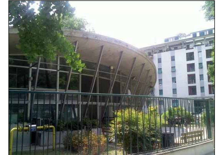
Esterno - Ingresso