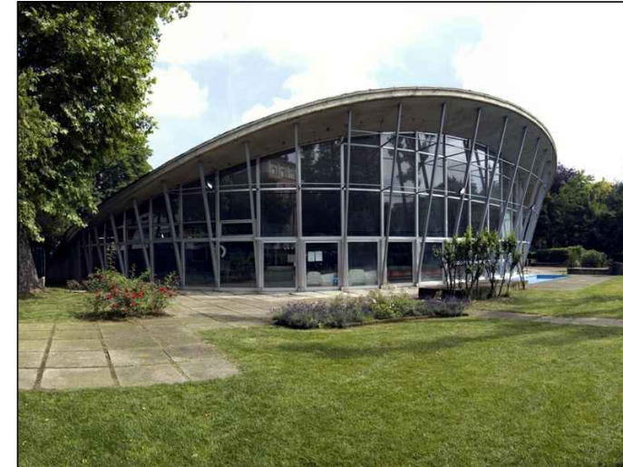
Esterno - Vista Posteriore