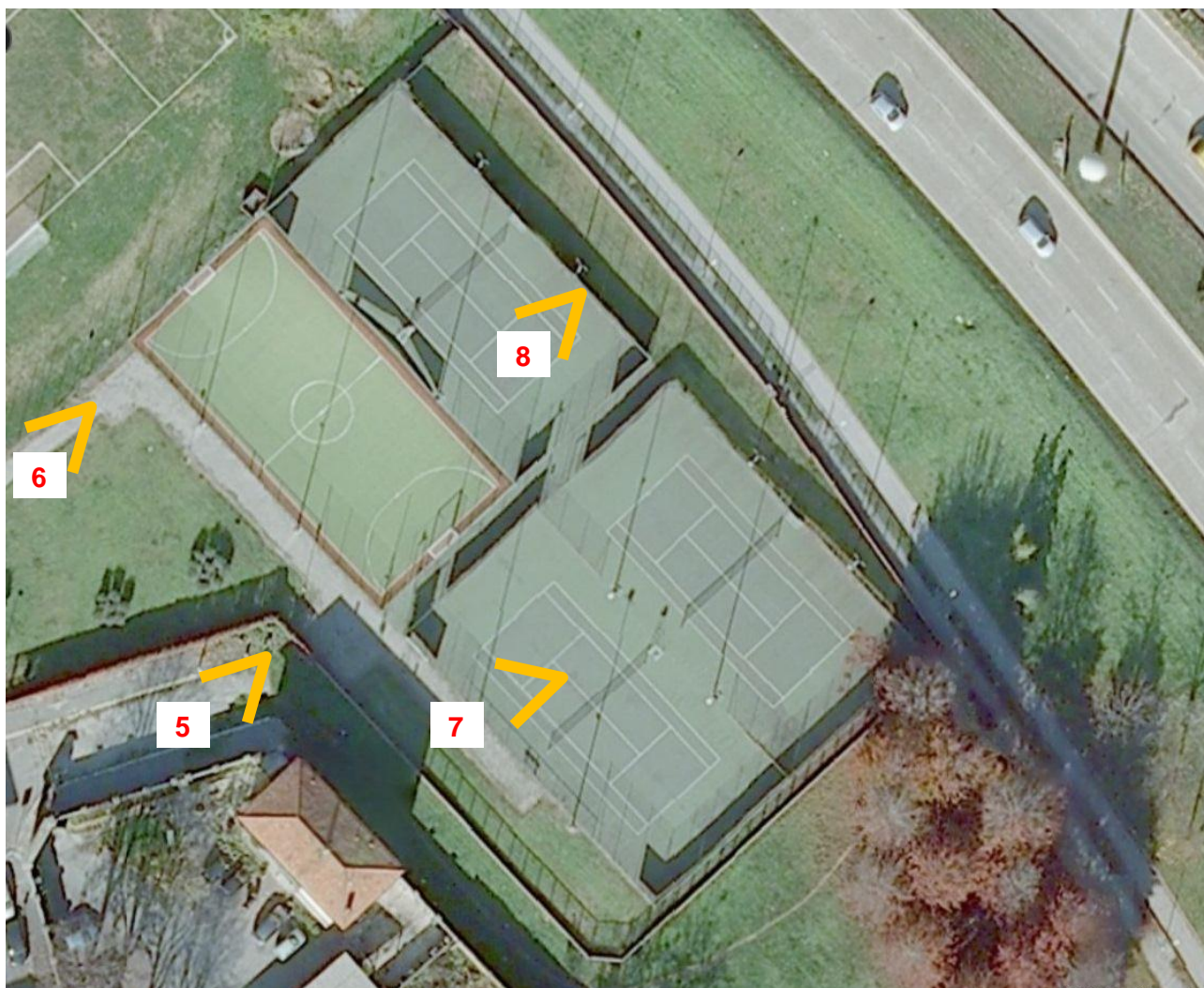
Foto n. 4. – Vista dall'alto dell'area di intervento con indicazione angolazione scatti fotografici