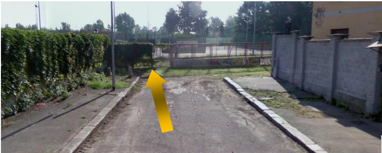
Foto n. 5. – Ingresso da utilizzarsi in fase di cantiere – Via Sand George A. L. Dupin