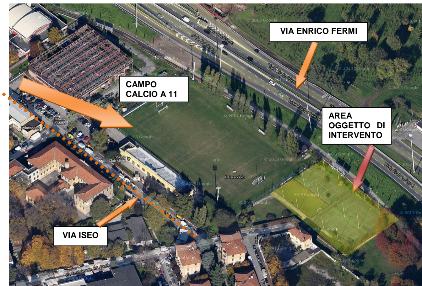
Foto n. 2. – Vista dall’alto del campo con indicazione di Via Iseo