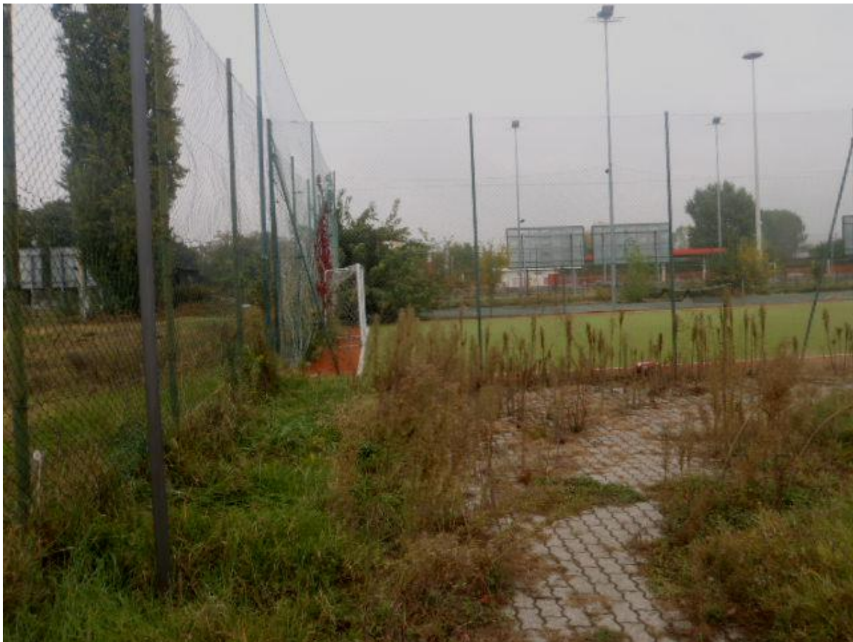
Foto n. 6. – Percorso interno a confine con il campo di calcio a 11